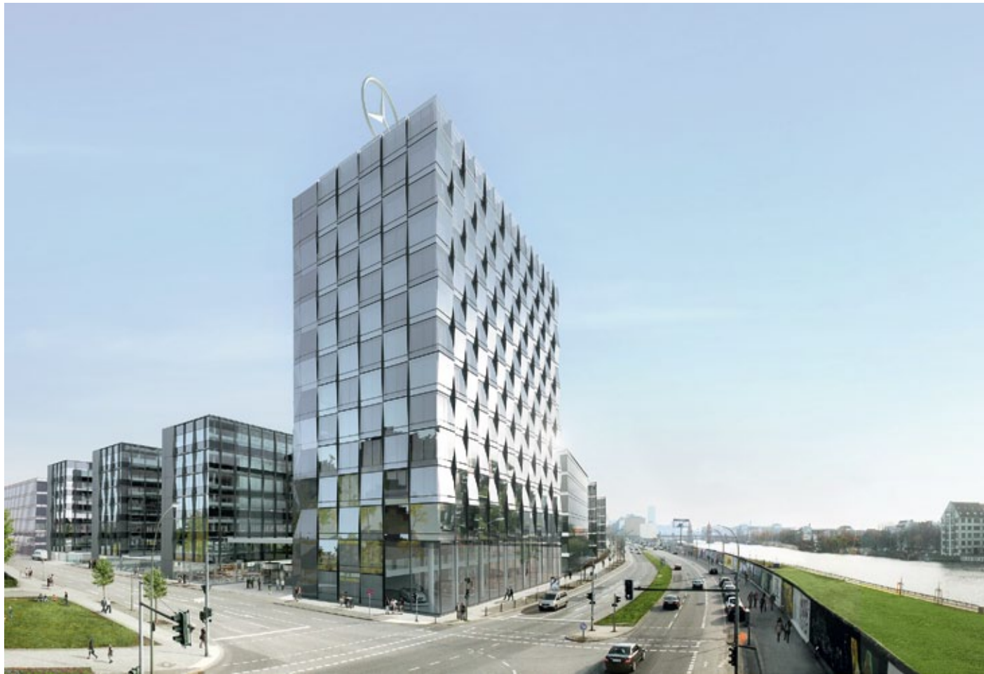
Zentrale Mercedes-Benz Vertrieb Deutschland, Berlin, im Bau, Fertigstellung 2013 (o.)