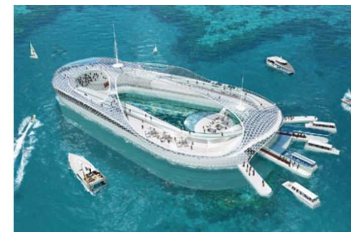
Hydropolis Unterwasserhotel Hainan, China, in Planung

Pudewill: Wir diskutieren in Europa und speziell in Deutschland mitunter jahrzehntelang über den Bau einzelner Gebäude, da ist es aus meiner Sicht mehr als legitim, bei einem neuen großen Stadtteil in der Nähe der heiligsten Stätte einer der großen Religionen auch alle Aspekte gründlich zu prüfen und gegeneinander abzuwägen. Bei einem Projekt dieser Bedeutung und Ausstrahlung wären schnelle unreflektierte Entscheidungen sicher eine Sackgasse.