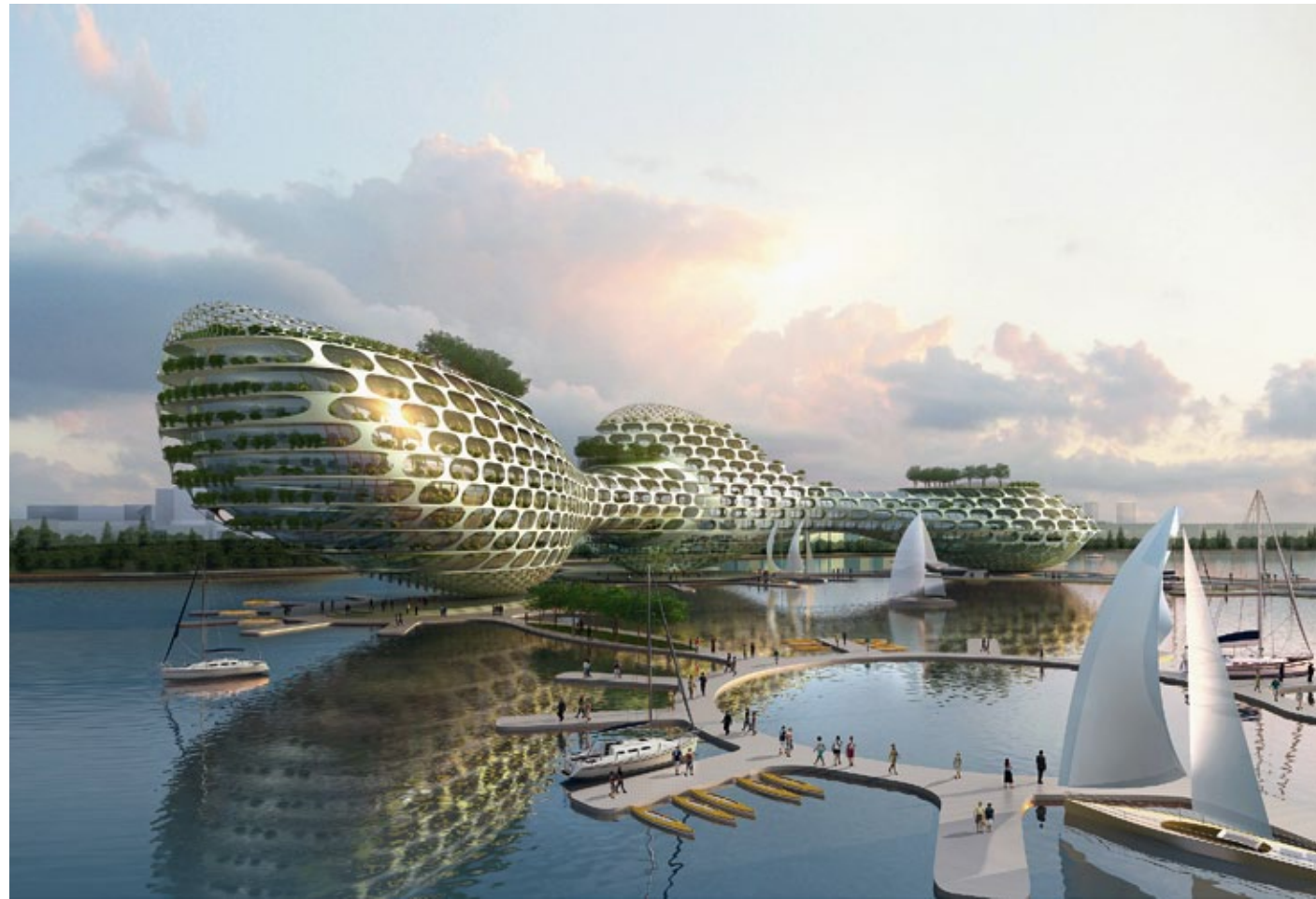
Souzhou Dushu Lake, ökologische Wasserstadt, 2. Preis, internationaler Wettbewerb 2011, Souzhou, China (o.)

Technologiezentrum – Bosch und Siemens Hausgeräte GmbH, Berlin, 2011 (u.)