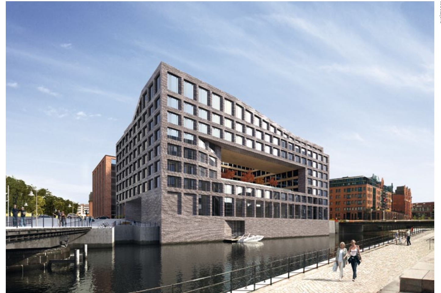
Unternehmenszentrale Marquard & Bahls, HafenCity Hamburg, 1. Preis, geladener Wettbewerb 2012, Fertigstellung 2014

sen mit vitalen Bedürfnissen und Maßstäben, die er an sein urbanes Umfeld anlegt.